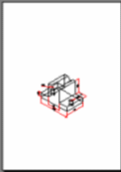
الشكل (٧- ٧)

10 - اضغط Enter لتنفيذ عملية الطباعة واخراجها .